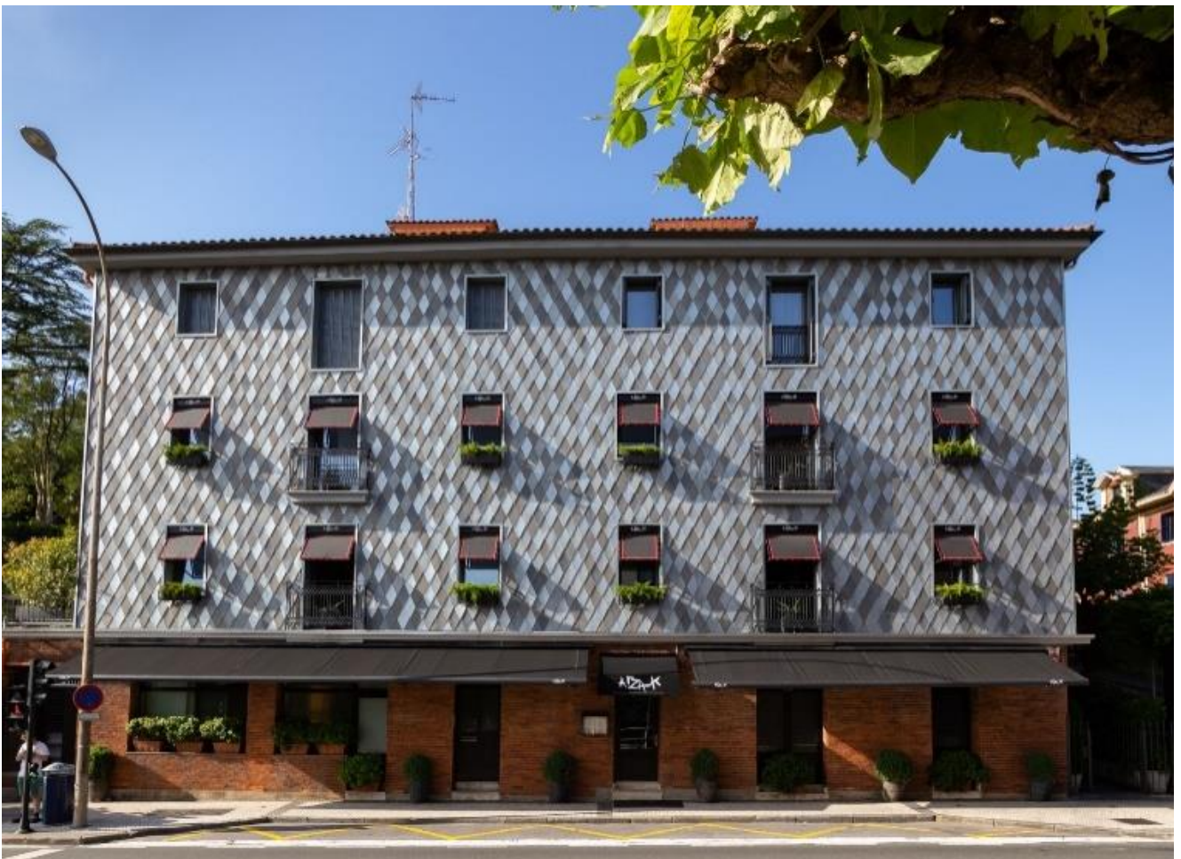
La nouvelle façade confère une identité bien marquée au restaurant

La patine naturelle formée par le zinc - qui le protège de la corrosion- a également interpellé le cabinet d'architecture car « elle accompagnera le bâtiment au fil des années ».