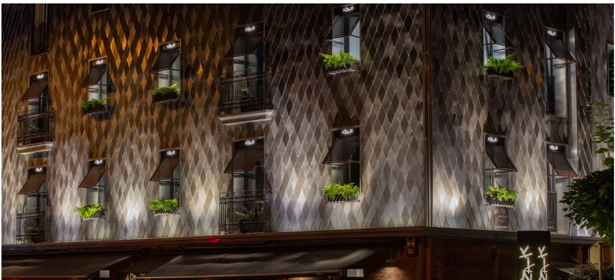
La fachada cambia con la luz ambiente y también cambia entre el día y la noche con un tratamiento de iluminación desde la parte inferior.

Es destacable el hecho de que se trata de una fachada que cambia mucho con la luz ambiente, existiendo también cambio entre el día y la noche con un tratamiento de iluminación desde la parte inferior. "Nos encanta ver que la gente ya no se hace la foto sólo en la puerta del restaurante, sino que también intentan que salga parte de la fachada", afirma Manuel. "Ambas partes estamos satisfechas con el resultado porque sentimos que la fachada ayuda a representar más la identidad del restaurante".