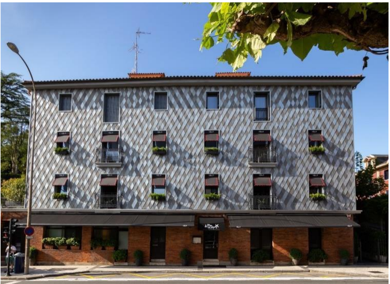
De nieuwe gevel van het restaurant geeft het restaurant meer karakter.